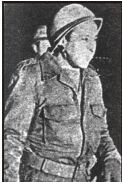
El asesino de Trelew Capitán de Corbeta Luis Emilio Sosa

Sosa, el capitán de corbeta. Sosa, el que se comprometió -en presencia de un juez y frente a testigos- a trasladar a los evadidos nuevamente al penal de Rawson, Sosa, el que les garantizó que no los recluiría en la Base Aeronaval Almirante Zar. Sosa, el que se mostró ofendidísimo cuando los presos políticos le manifestaron que su negativa a quedar detenidos en una base de la Marina obedecía a experiencias personales de torturas y vejámenes por parte de personal de esa fuerza. Sosa, el mismo que se asombró porque alguien pudiera temerle. Sosa, el mismo que traicionó su palabra de honor? y apenas los diecinueve jóvenes se entregaron, después de deponer sus armas, los subió a un colectivo para hacer exactamente lo opuesto a aquello que había pactado. Sosa, el que se sintió dueño y señor de hacer su voluntad y que los depositó, seguramente con regocijo, en la Base Aeronaval donde consumaría su masacre.