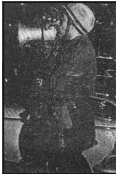
El asesino de Trelew dirigiéndose a los cros. en el aeropuerto